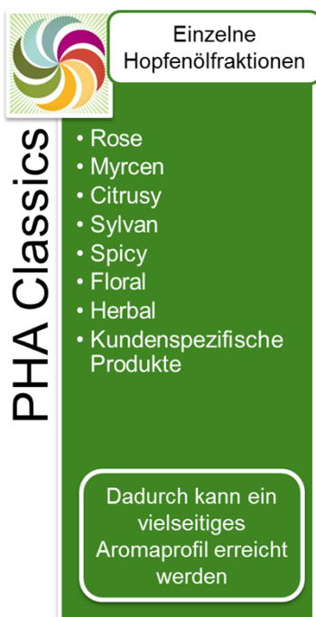
Abbildung 1: PHA® Classics

Die PHA® Classics Produkte werden mittels spezifischer Extraktions- und Destillationsmethoden aus Hopfendolden hergestellt. Dabei liegt das originäre Hopfenöl in einer Propylenglykol-Lösung vor. Propylenglykol ist ein anerkannter Zusatzstoff gemäß der EU Richtlinie 2006/52/EC. Die PHA® Produkte werden weltweit ausschließlich von BarthHaas vertrieben.