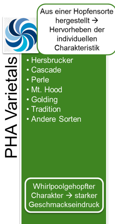
Abbildung 1: PHA® Varietals

Die PHA® Varietals werden mittels spezifischer Extraktions- und Destillationsmethoden aus Hopfendolden hergestellt. Dabei liegt das originäre Hopfenöl in einer Propylenglykol-Lösung vor. Propylenglykol ist ein anerkannter Zusatzstoff gemäß der EU Richtlinie 2006/52/EC. Die PHA® Produkte werden weltweit ausschließlich von BarthHaas vertrieben.