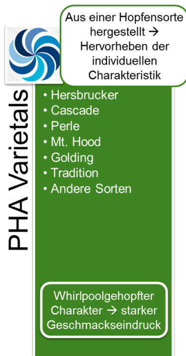
Abbildung 1: PHA® Varietals

Die PHA® Varietals werden mittels spezifischer Extraktions- und Destillationsmethoden aus Hopfen hergestellt. Dabei liegt das originäre Hopfenöl in einer Propylenglykol-Lösung vor. Propylenglykol ist ein anerkannter Zusatzstoff gemäß der EU Richtlinie 2006/52/EC. Die PHA® Produkte werden weltweit ausschließlich von BarthHaas vertrieben.