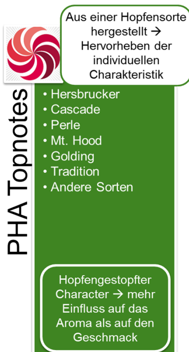
Abbildung 1: PHA® Topnotes

Die PHA® Topnotes Produkte werden mittels spezifischer Extraktions- und Destillationsmethoden aus Hopfen hergestellt. Dabei liegt das originäre Hopfenöl in einer Propylenglykol-Lösung vor. Propylenglykol ist ein anerkannter Zusatzstoff gemäß der EU Richtlinie 2006/52/EC. Die PHA® Produkte werden weltweit ausschließlich von BarthHaas vertrieben.