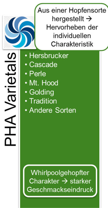
Abbildung 1: PHA® Varietals

Die PHA® Varietals werden mittels spezifischer Extraktions- und Destillationsmethoden aus Hopfen hergestellt. Dabei liegt das originäre Hopfenöl in einer Propylenglykol-Lösung vor. Propylenglykol ist ein anerkannter Zusatzstoff gemäß der EU Richtlinie 2006/52/EC. Die PHA® Produkte werden weltweit ausschließlich von BarthHaas vertrieben.