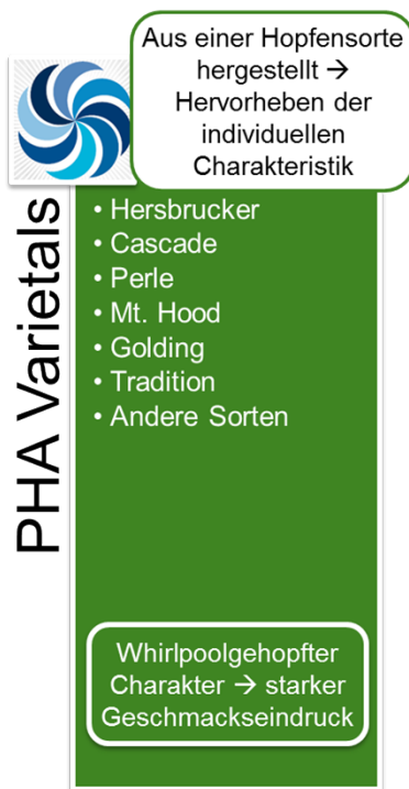
Abbildung 1: PHA® Varietals

Die PHA® Varietals werden mittels spezifischer Extraktions- und Destillationsmethoden aus Hopfen hergestellt. Dabei liegt das originäre Hopfenöl in einer Propylenglykol-Lösung vor. Propylenglykol ist ein anerkannter Zusatzstoff gemäß der EU Richtlinie 2006/52/EC. Die PHA® Produkte werden weltweit ausschließlich von BarthHaas vertrieben.