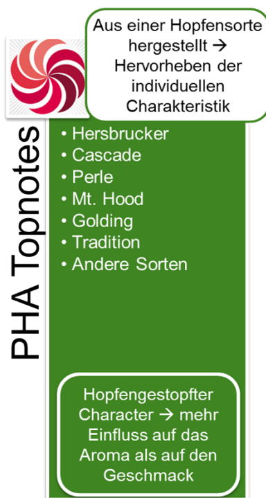
Abbildung 1: PHA® Topnotes

Die PHA® Topnotes Produkte werden mittels spezifischer Extraktions- und Destillationsmethoden aus Hopfen hergestellt. Dabei liegt das originäre Hopfenöl in einer Propylenglykol-Lösung vor. Propylenglykol ist ein anerkannter Zusatzstoff gemäß der EU Richtlinie 2006/52/EC. Die PHA® Produkte werden weltweit ausschließlich von BarthHaas vertrieben.