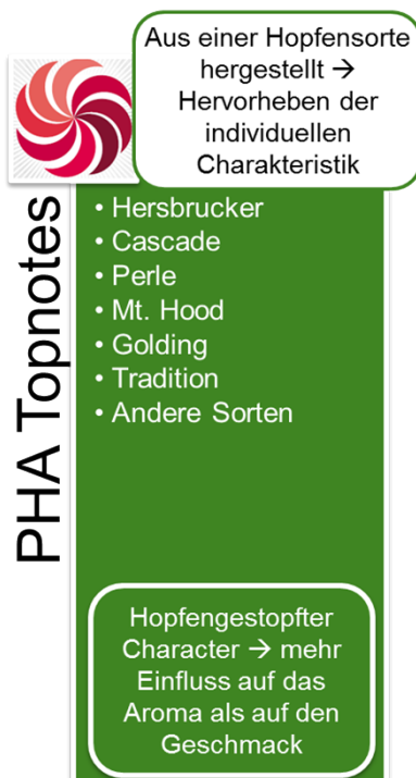
Abbildung 1: PHA® Topnotes

Die PHA® Topnotes Produkte werden mittels spezifischer Extraktions- und Destillationsmethoden aus Hopfen hergestellt. Dabei liegt das originäre Hopfenöl in einer Propylenglykol-Lösung vor. Propylenglykol ist ein anerkannter Zusatzstoff gemäß der EU Richtlinie 2006/52/EC. Die PHA® Produkte werden weltweit ausschließlich von BarthHaas vertrieben.