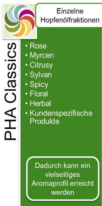
Abbildung 1: PHA® Classics

Die PHA® Classics Produkte werden mittels spezifischer Extraktions- und Destillationsmethoden aus Hopfen hergestellt. Dabei liegt das originäre Hopfenöl in einer Propylenglykol-Lösung vor. Propylenglykol ist ein anerkannter Zusatzstoff gemäß der EU Richtlinie 2006/52/EC. Die PHA® Produkte werden weltweit ausschließlich von BarthHaas vertrieben.